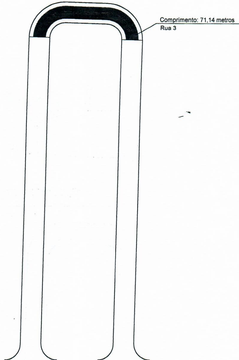
CROQUI DE SITUAÇÃO