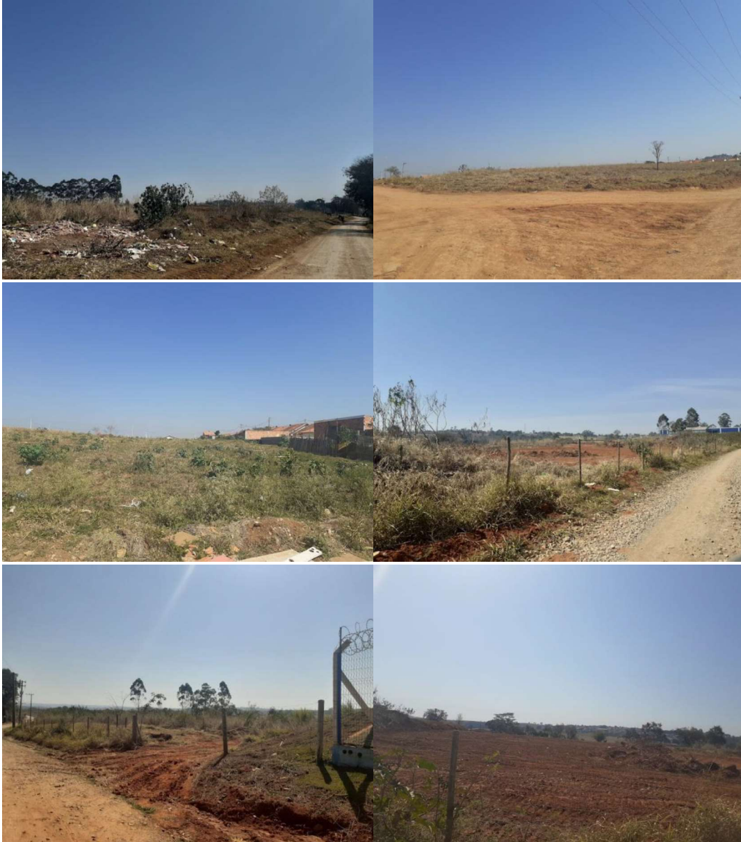
Empresas instaladas ao lado do imóvel