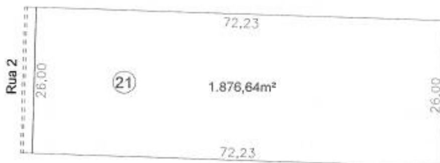
Croqui da Gleba 21