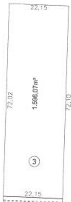
Croqui da Gleba 03