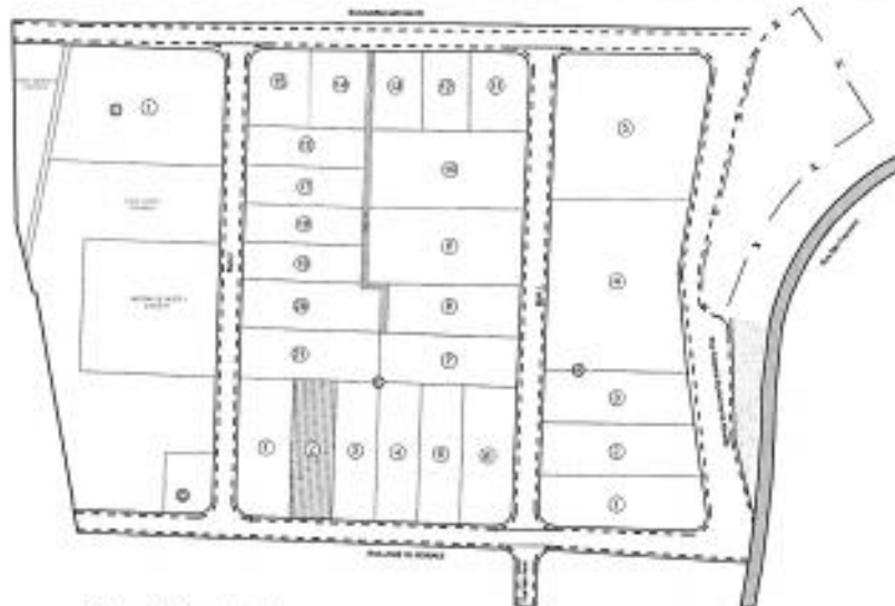
Croqui de Localização