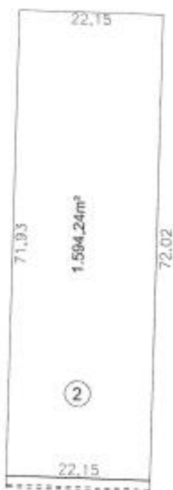
Croqui da Gleba 02