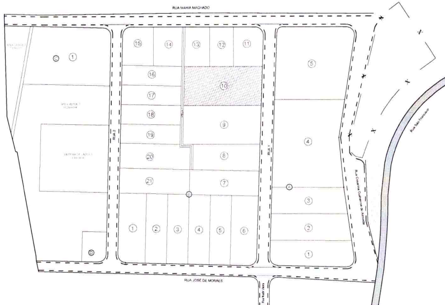
Croqui de Localização