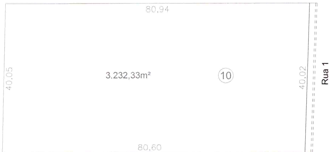
Croqui da Gleba 10