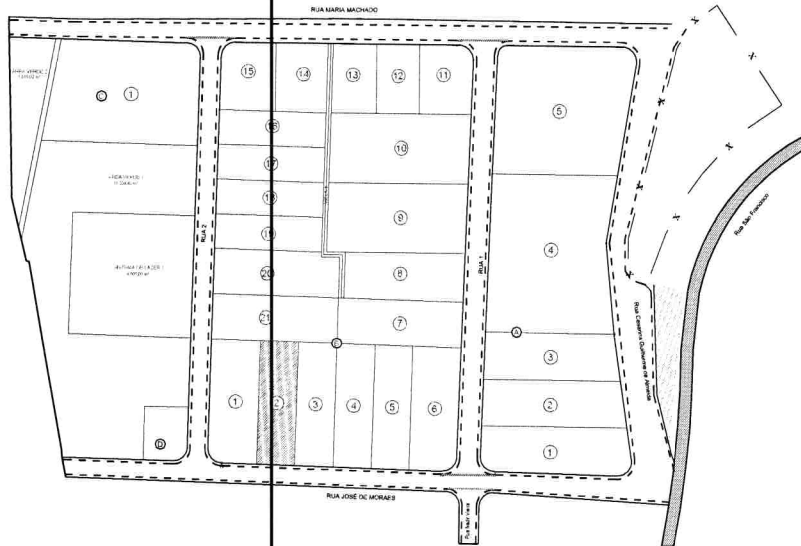
Croqui de Localização