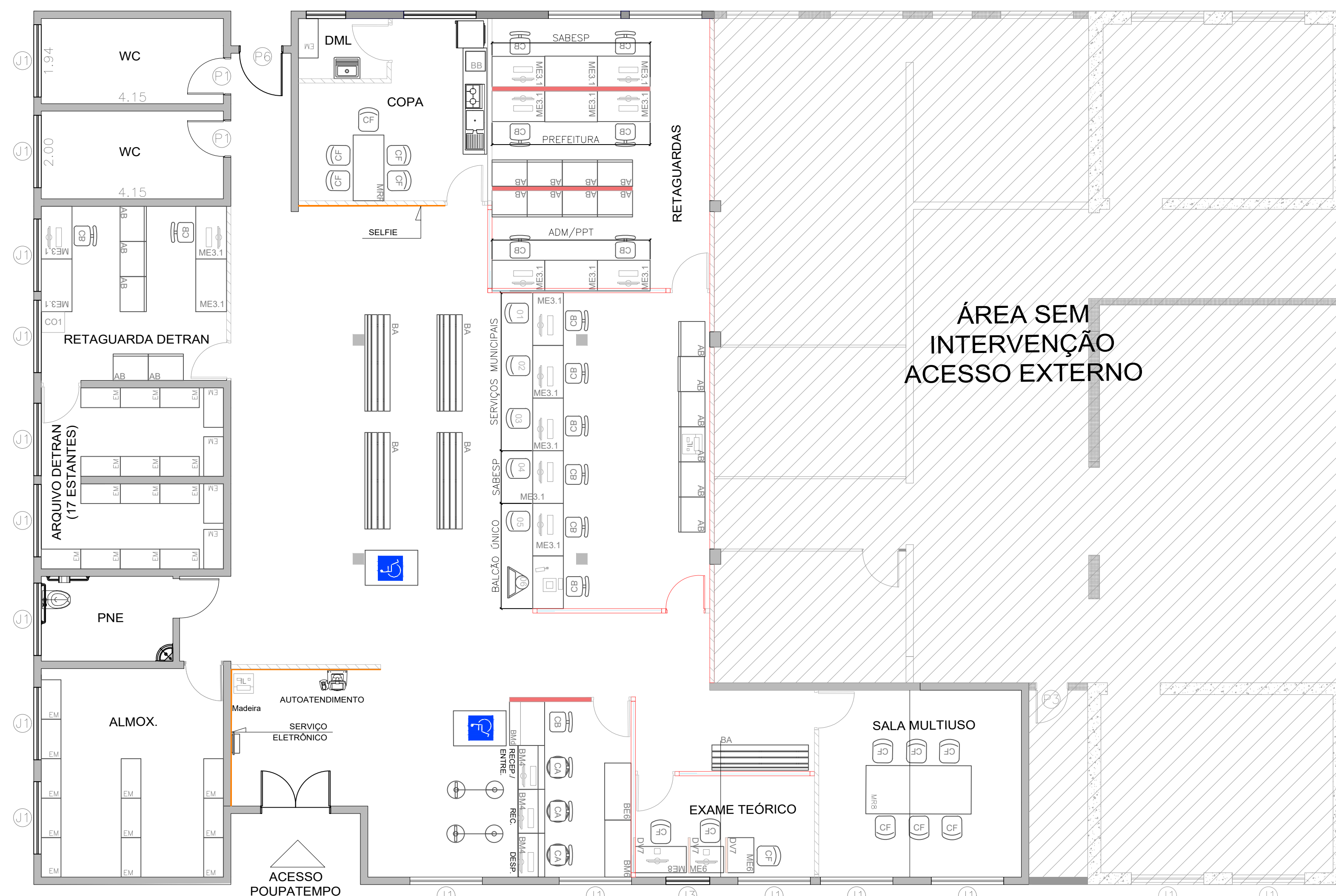
PLANTA BAIXA - LAYOUT ESCALA: 1:75