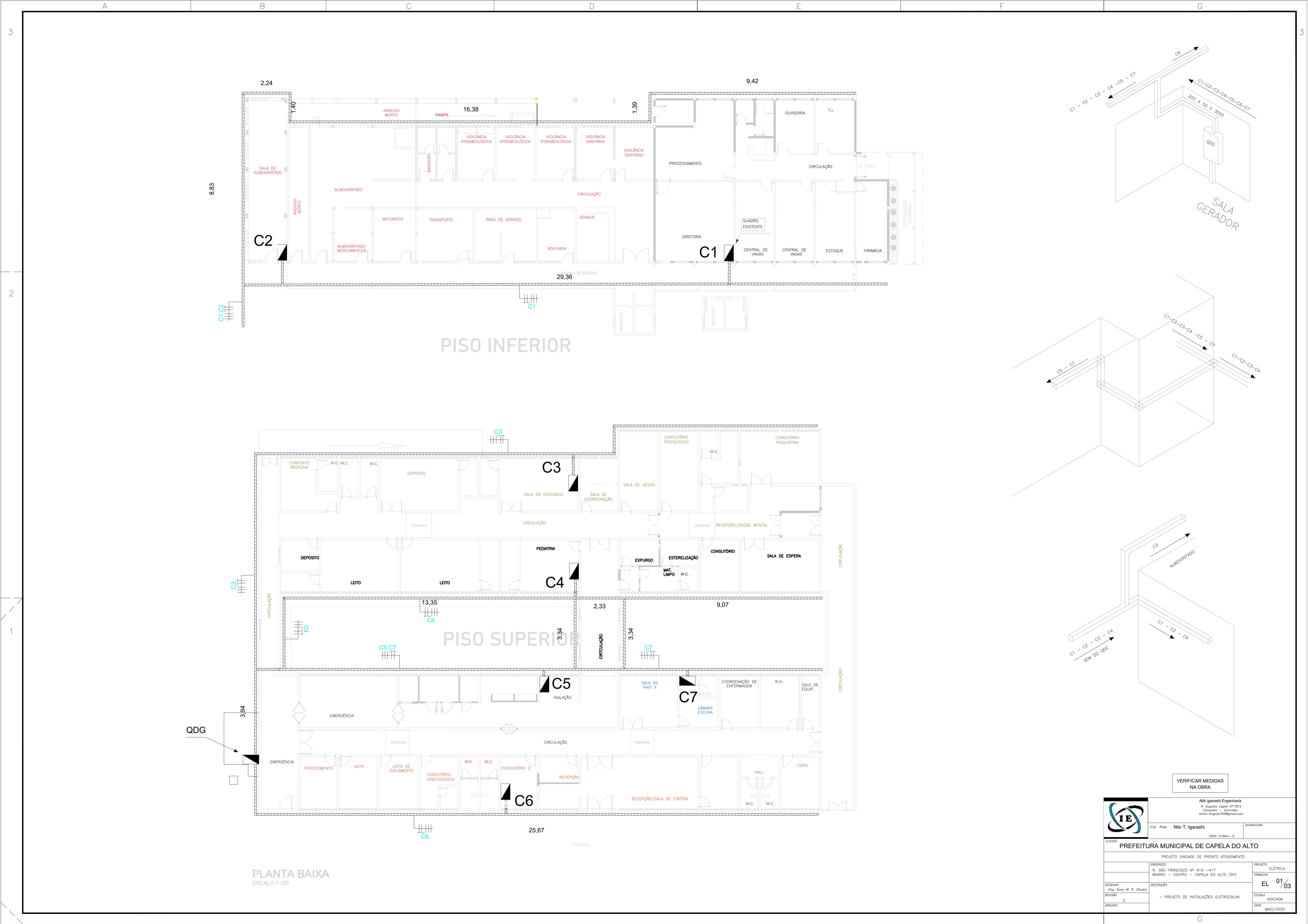
PLANTA BAIXA ESCALA 1:100