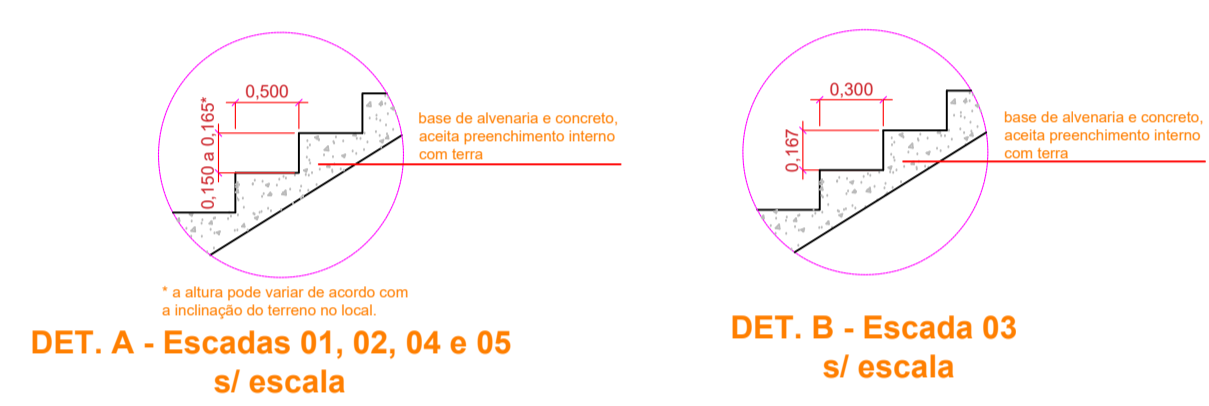
DET. ESCADAS - S/ ESCALA