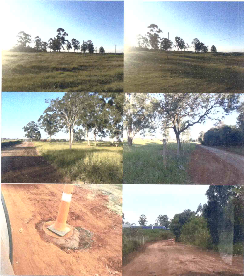
Empresas instaladas ao lado do imóvel