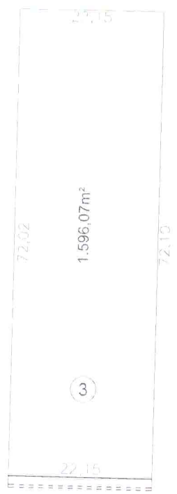
Croqui da Gleba 03