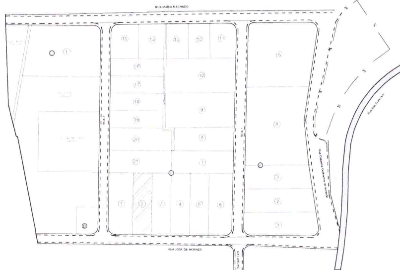
Croqui de Localização