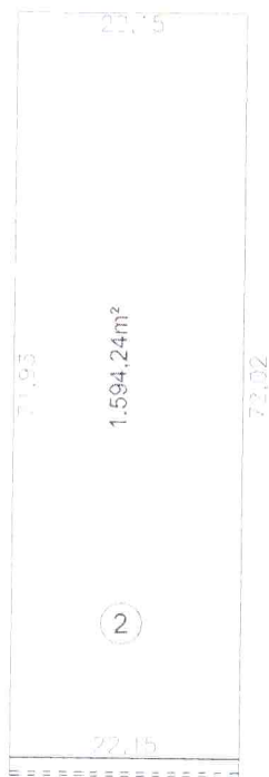
Croqui da Gleba 02