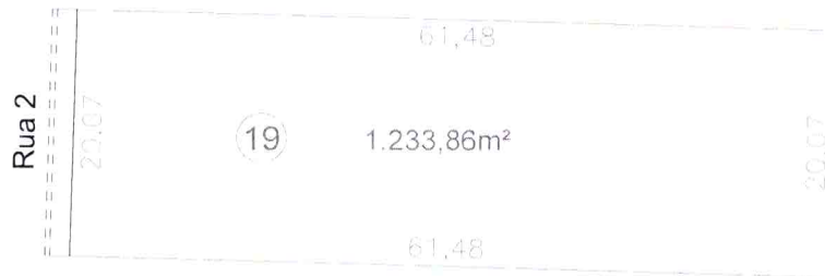
Croqui da Gleba 19