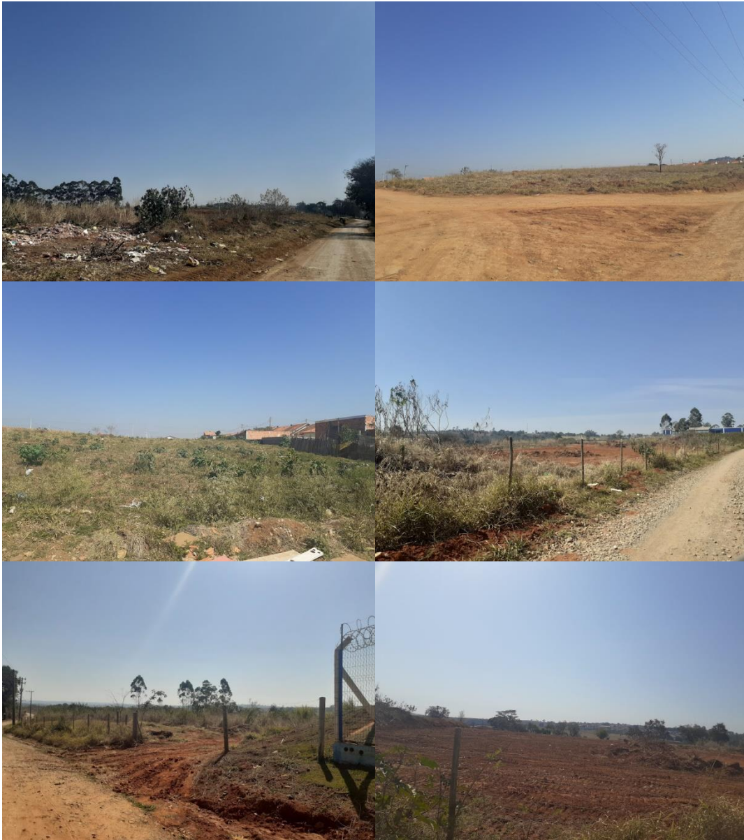
Empresas instaladas ao lado do imóvel