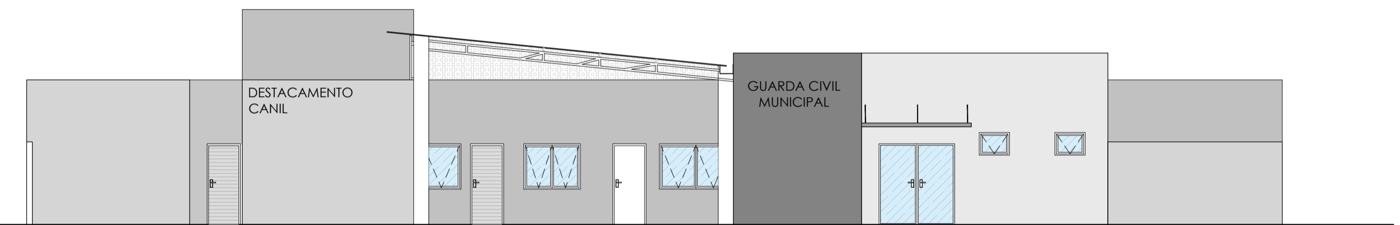
ELEVAÇÃO ESC 1:100